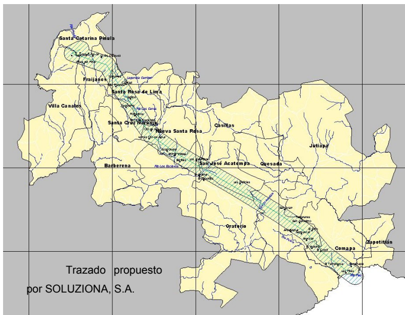
Mapa 2.5.3: Esquema del trazado de la ruta Guate – Este – El Salvador.

Desde este punto, la línea adopta una dirección este, atravesando casi perpendicularmente la